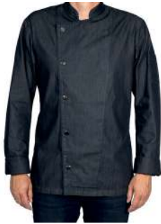
KOCHJACKE BASIC DENIM 60° ✳️ 📦 📐 ✳️