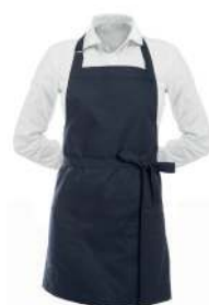
LATZSCHÜRZE KURZ 75° △ ⊗ ⊚ ⊛ ⊜ ⊝