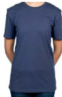
BASIC T-SHIRT BLAU 60° ✳️ 📦 📐 ✳️