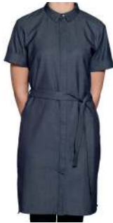
HEMDKLEID DENIM 60° ✳️ 📦 📐 ✳️