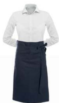
BISTROSCHÜRZE 75° △ ⊗ ⊚ ⊛ ⊜ ⊝