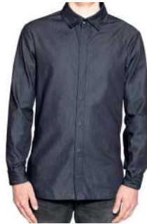
SERVICEHEMD DENIM 60° ✳️ 📦 📐 ✳️