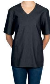
KASACK DENIM 60° ✳️ 📦 📐 ✳️