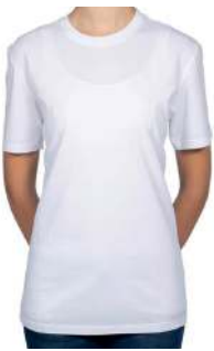
BASIC T-SHIRT WEISS 60° ✳️ 📦 📐 ✳️