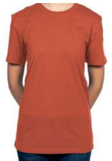
BASIC T-SHIRT ROSTROT 60° ✳️ 📦 📐 ✳️