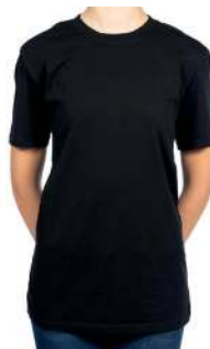
BASIC T-SHIRT SCHWARZ 60° ✳️ 📦 📐 ✳️