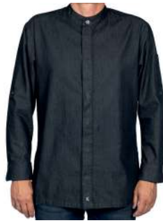
KOCHJACKE PREMIUM DENIM 60° ✳️ 📦 📐 ✳️