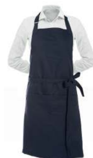
LATZSCHÜRZE LANG 75° △ ⊗ ⊚ ⊛ ⊜ ⊝