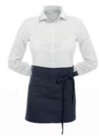
SERVICESCHÜRZE 75° △ ⊗ ⊚ ⊛ ⊜ ⊝