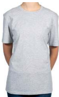
BASIC T-SHIRT GRAU MELIERT 60° ✳️ 📦 📐 ✳️